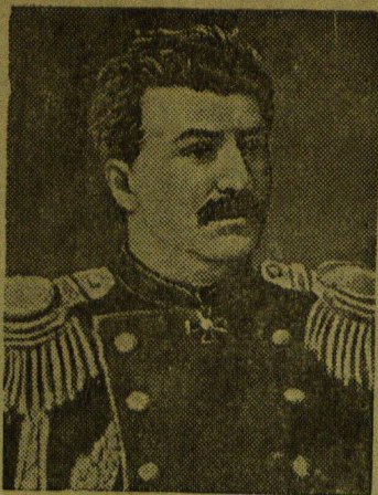
Известный русский путешественник Н. М. Пржевальский, 60-летие со дня смерти которого советская общественность отметила в ноябре с. г.